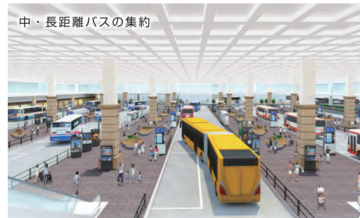
中・長距離バスの集約