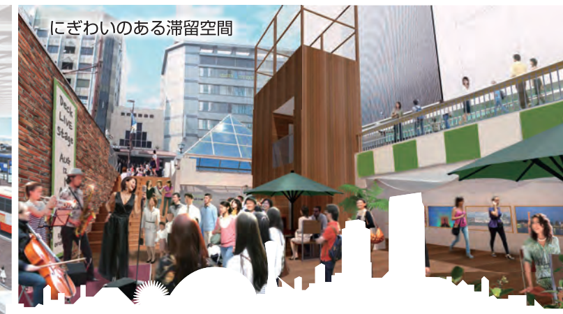
にぎわいのある滞留空間