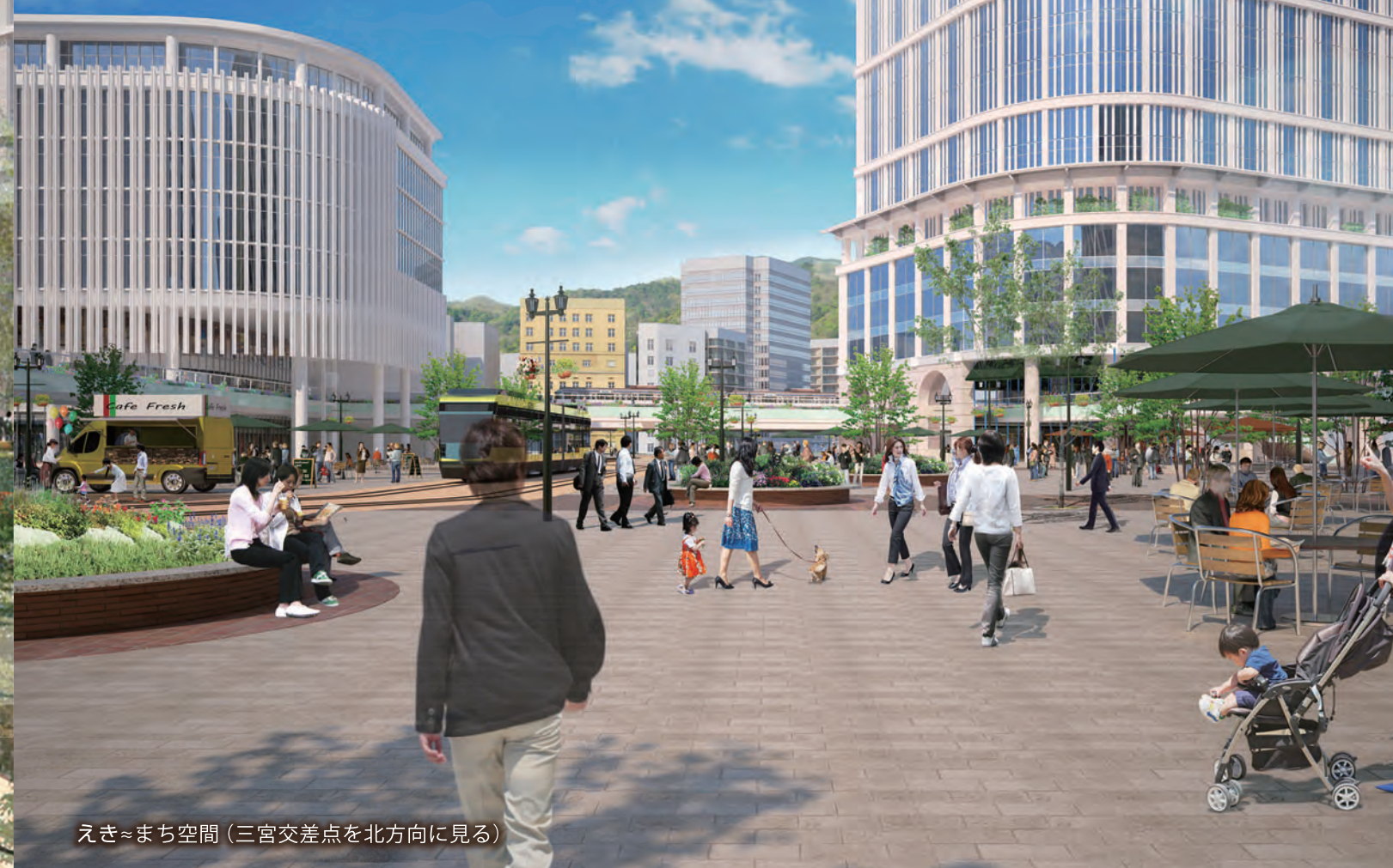
えき〜まち空間（三宮交差点を北方向に見る）

まちであり駅である空間、「えき」(6つの駅とバス乗降場、駅前広場)と「まち」をつなぐ空間を 「えき〜まち空間」と名付け、神戸の玄関口としてふさわしい空間を整備します。