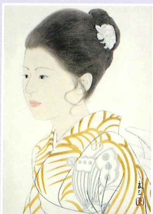
大橋良三(M嬢の像)1972年(紙本着色) 神戸ゆかりの美術館