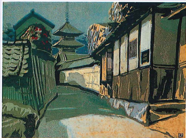
突々和夫(法隆寺早春)1977年(木版・紙) 神戸ゆかりの美術館

突々和夫(とつとつかずお)は、静謐な雰囲気漂う木版画を制作したことで知られています。一九四九年に京都市立美術専門学校日本画専攻(現・京都市立芸術大学)を卒業後、赤穂、加古川で教鞭を執ったのち兵庫県立長田高等学校へ移り一九七〇年代から木版画制作を始めています。制作拠点の神戸の身近な名所や、憧れであった万葉の舞台奈良の寺院、倉敷・赤穂などの瀬戸内の街並みを好んで題材にしました。日本画制作でつちかっていた滋味豊かな色彩で表現された木版画は、湿润な日本の気候や清涼感ある光を感じさせます。本展では、平成二十三年に作家ご本人から寄贈された木版画、制作スケッチ、版木等二十五点をご紹介します。あわせて神戸・北野 White House コレクションから明快な色彩が持ち味の川西英、シャープで都会的な祐三郎父子の木版画、別車博資の清澄な水彩画、西村功のパステルを併用した爽やかな水彩画等を公開いたします。神戸ゆかりの画家たちによる個性溢れる美しい色彩の世界をご堪能いただける展覧会です。