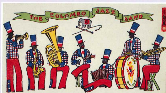
川西英(楽隊)1929年(木版・紙) 神戸・北野 White House コレクション