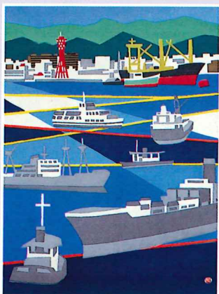
川西祐三郎(出船入船)1981年(木版・紙) 神戸ゆかりの美術館