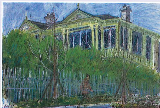
西村功(旧ハンター邸)1989年(水彩・パステル・紙) 神戸・北野 White House コレクション