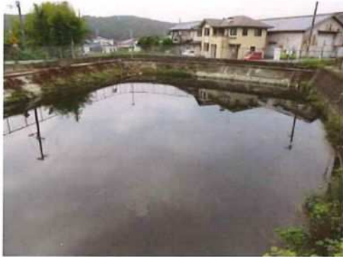
写真 6 (菖蒲谷池)