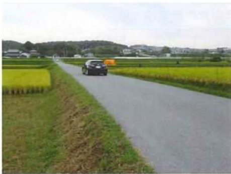
写真 3 (抜け道を通過する車)