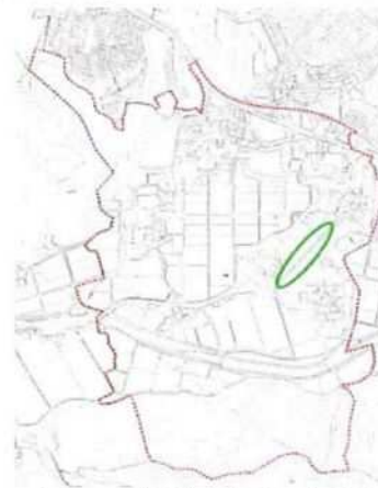
図 4 (幼稚園付近の水路)