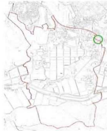
図 2 (西盛口交差点)