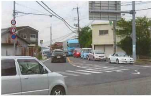
写真 2 (西盛口交差点)