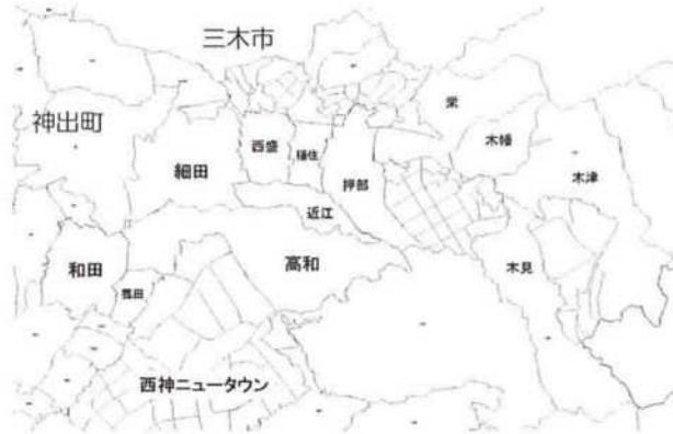
押部谷町の各集落