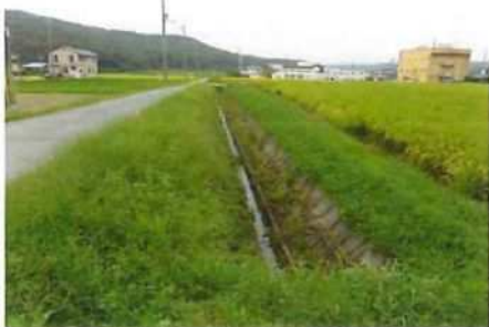
写真 4 (幼稚園付近の水路)