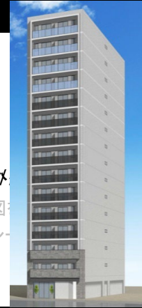
外観イメージです。また、写真もご用意しております。ご確認ください。