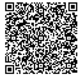
民泊相談窓口予約