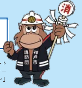
消防団マスコット キャラクター 「ウータン」

「自らの地域は自ら守る」という精神に基づき、地域の暮らしを守る、西区の消防団についてご紹介します。