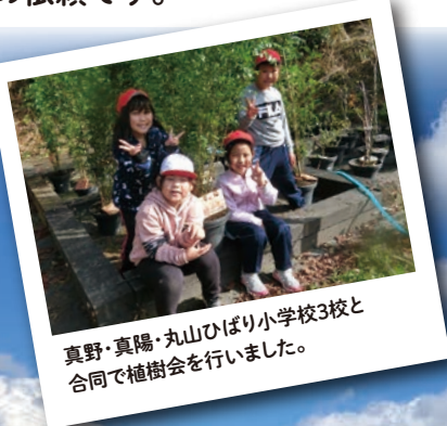
真野・真陽・丸山ひばり小学校3校と合同で植樹会を行いました。