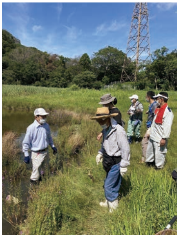
アカミミガメ防除活動の様子。