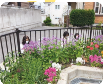
ムラサキハナナ [春]

宅にもチョウの好きな草花を植えている。 チョウは現在まで38種確認されており、平成28年には「人と生き物が共生している」と認められ「兵庫県人間サイズのまちづくり賞」の花緑部門で知事賞を受賞。また、最近では阪神・淡路大震災以降放置されていた空き地を整備してチョウの好む草花を植えるなど、空き地活用にも取り組んでいる。 これらの取り組みを通して、住民が自然とふれあい癒やされるまちを目指しているという。珍しいチョウも生息しているそうなので、二度足を運んでみては。