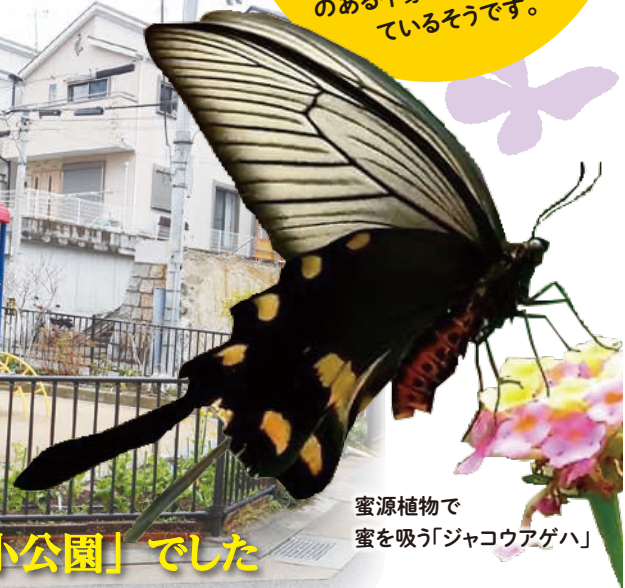
蜜源植物で蜜を吸う「ジャコウアゲハ」

【依頼募集】 長田区にまつわる謎や疑問をお寄せください。ながた探偵団が全力で調査します。電話、FAX、手紙、SNSからご連絡ください。あなたの依頼が掲載されるかも!? ☎長田区まちづくり課広報紙担当 ☎579-2311(内線:212) FAX579-2301