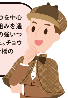
まちづくり課 長田探偵

この地域ではチョウを中心にさまざまな取り組みを通して住民の皆さんの強いつながりを感じました。チョウは人々をつなぐ懸け橋のような存在ですね!