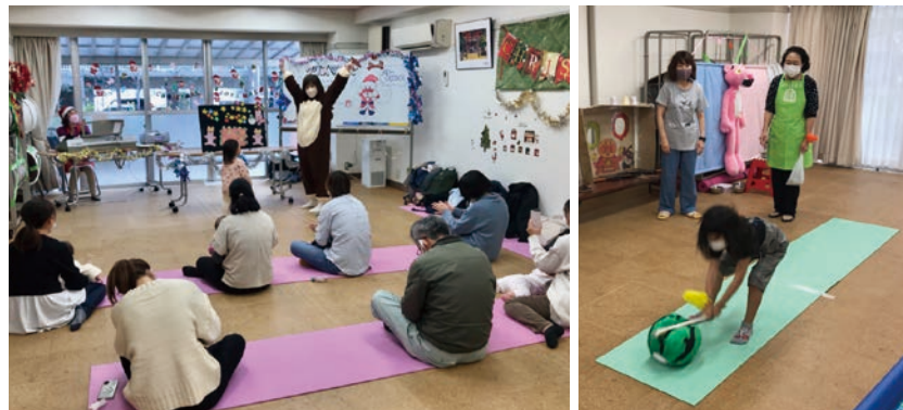
◆西代北部地区の「育児おしゃべりサロン」での様子