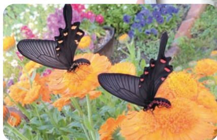
マリーゴールドとジャコウアゲハ [秋]