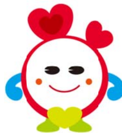
表情など細部を部分的に変更して利用