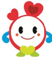
左右反転して利用