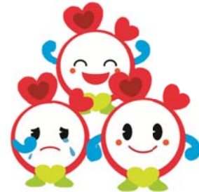
キャラクターを重ねて利用