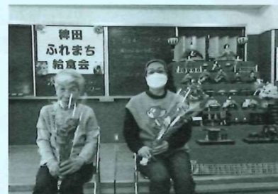
毎月のお誕生会 3月は おひなさまと