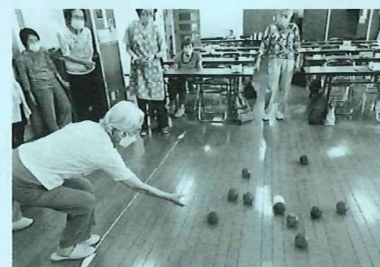
ボッチャ 白玉をめがけて