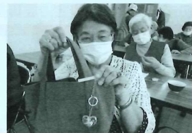
完成してバッグにつけてニコリ!