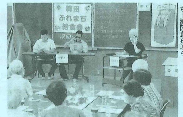
犯人が使用する手口を再現する署員たち ちい灘区倉石通4