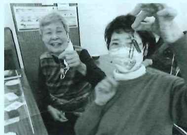
給食会で手芸の先生に習ってハートのチャームを手作り♪