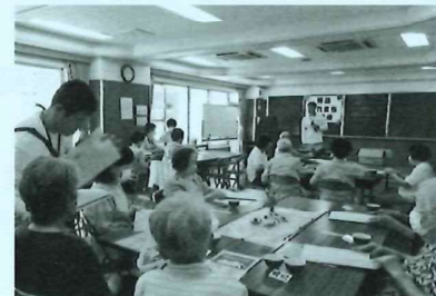
パンフレットをいただきました