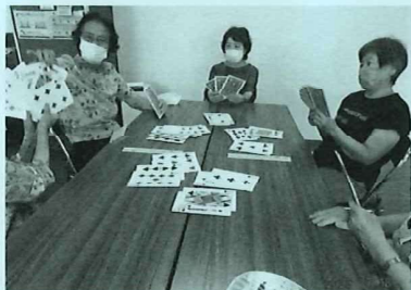
トランプでばばぬき