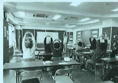
ウォーミングアップ!