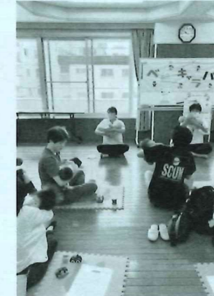
7/14 ベビーキャラバン1才までの乳児と親の参加親子遊びや子育てエピソードに楽しいひとときでした