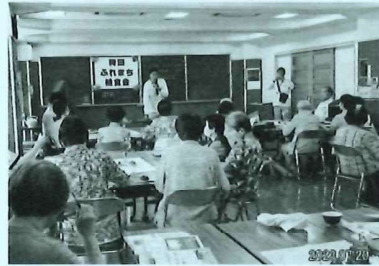
灘環境局からゴミ分別の細かいルールをききました