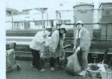
クリーン作戦の9月 16名で道路のおそうじもしました