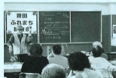
「KOBE まなびすとネット」からベテランマジシャンをお呼びしました