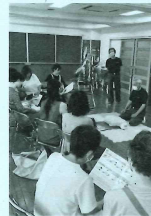
7/7 救急救命 消防団の方に指導してもらいましたお母さんの真剣なようすに子どももみとれてました