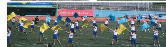
スポーツフェスティバル