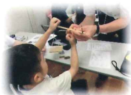
親子理科実験工作教室