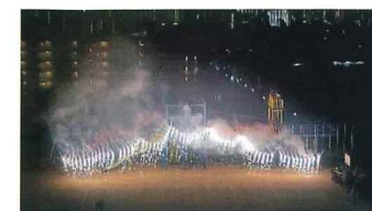
おやじの会 花火大会