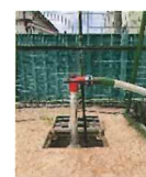
いつでもじゃぐち