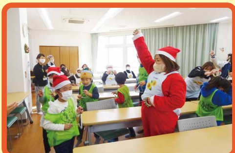
ハロウィンパーティーやクリスマス会など大人数で利用できます。