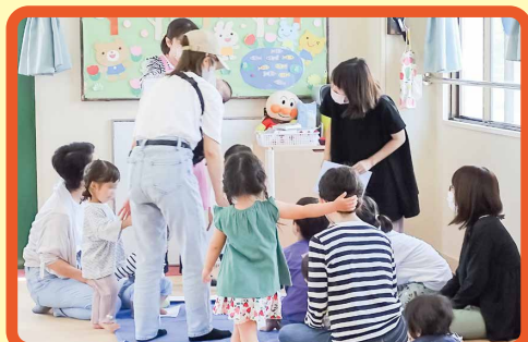
子育てサークルなど様々なグループの集まりなどで使われています。