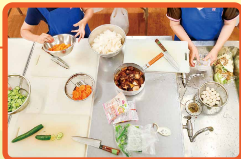
調理道具がそろっており、広いキッチンで料理を楽しめます。