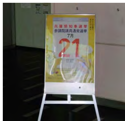
しゃべるポスター