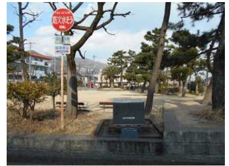
防火水槽（公園西面）