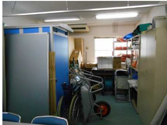
防災資機材倉庫（1階東側）