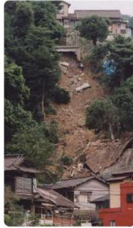
Sạt lở đất

có thể sẽ tăng lên bất chợt, vì thế hãy luôn lưu ý.