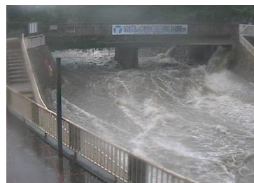
Sông Togagawa (Ngày 28/7/2008)