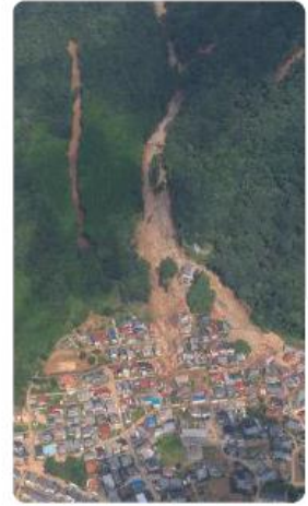
Lũ kèm đất đá