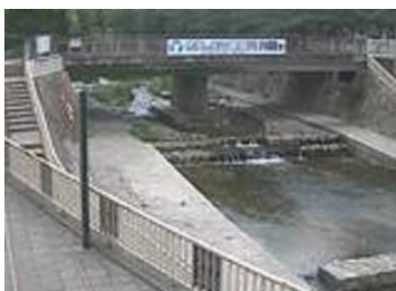
Lúc bình thường