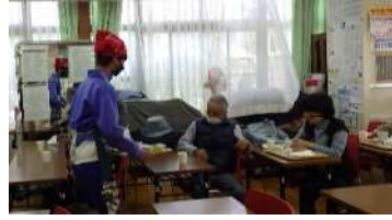
岩屋ふれまち ふれあい喫茶 (トライやる・ウィークに協力)

ふれまちの行事は各地域福祉センターで開催しています。 (要申込)は各地域福祉センターへ