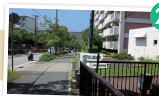
妙法寺駅へは直進。 六甲全山縦走路は右へ曲がる