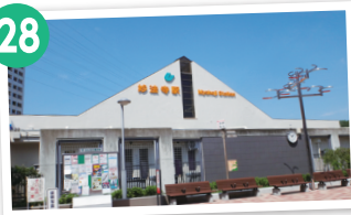
神戸市営地下鉄 妙法寺駅 WC 駅前にショッピングモールのある 妙法寺駅がゴール