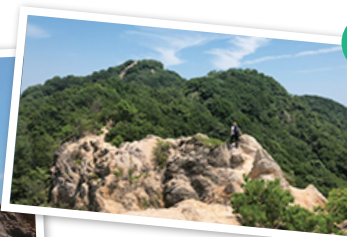
馬の背 眺望 スリリングな岩場歩きが楽しめる 須磨アルプスのハイライト