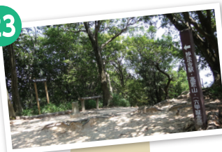
東山(山頂) 眺望 馬の背と板宿方面・妙法寺方面の三 差路。木陰のある休憩適地。六甲全 山縦走路の看板に従い、階段を下る