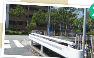
バス道のT字を右へ