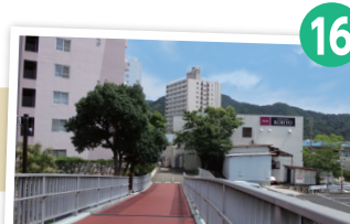
★ ★ 高倉台 近隣センター スーパーマーケット などが並ぶ、団 地の中の商業施設

「須磨アルプス」のメインパート。高倉台から標高差約100mの登りや、須磨アルプス最高峰の横尾山など、登りごたえもある。ハイライトは横尾山と東山との間の「馬の背」と呼ばれる岩稜帯で、切り立った荒々しい岩尾根は迫力満点。両側が切れ落ちた幅の狭い部分もあるので、慎重に行動しよう。すれ違いの際にはとくに注意を。