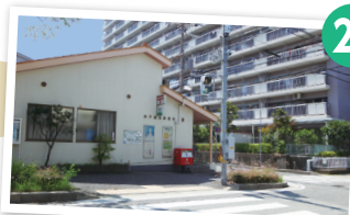
郵便局前の横断歩道を渡り、右へ