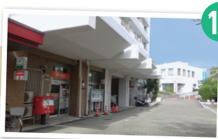
高倉台郵便局の前を通り、直進