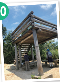
とがおやま 桐尾山(山頂) 眺望 木製の小さな展望台があり、明石海峡や神戸の市街地が一望