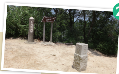
横尾山(山頂) 眺望 標高312m、須磨アルプスの最高 峰。狭い山頂には三角点がある