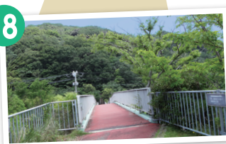
陸橋を渡り、突き当りを左へ