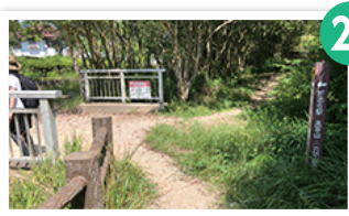
カーブの続く道を下ると山道 出口に。ここから住宅街へ。 歩道がないため、車に注意