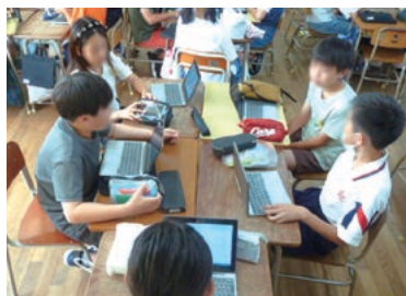
▲グループで意見交換

ぜひ、ご家庭でも非常時に必要なものを話し合い、防災セット作りに取り組んでみてください。