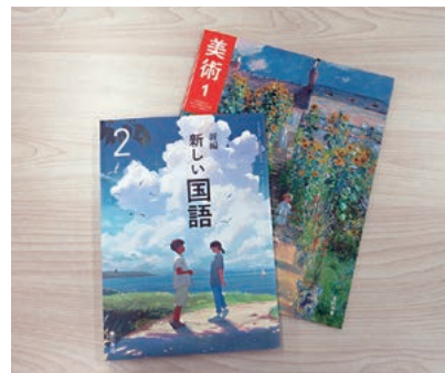
▲国語、美術の教科書 国語：東京書籍「新編 新しい国語2」表紙 美術：光村図書出版「美術1」表紙

知識・技能の習得、思考力・判断力・表現力等の育成、探究する意欲の向上につながる工夫やユニバーサルデザインへの配慮（図版・文字の大きさやレイアウト・色彩等）といった観点から採択しました。