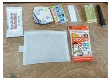
▲児童が選んだ防災グッズ

※「ともしびプロジェクト」とは 震災を振り返り、防災意識を高めていくため、「いつも ところに ともしびを」を合言葉に、1年間を通して地域・学校などのコミュニティ単位で防災教育を実践する活動です。