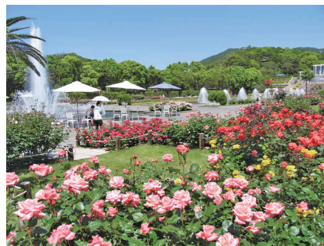
須磨離宮公園(平成29年)