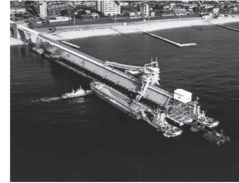
須磨ベルトコンベア 船積機橋(昭和40年代)