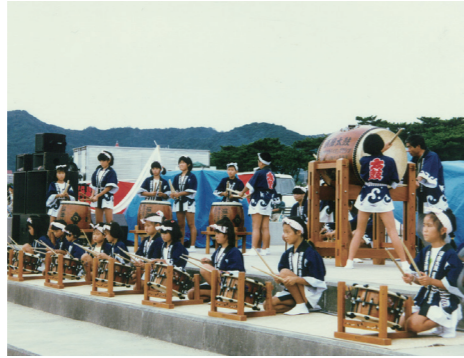
須磨太鼓(平成元年)