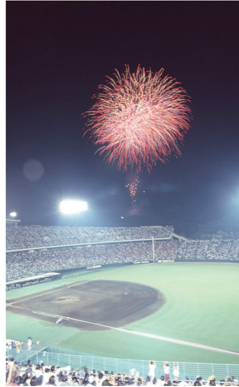
グリーンスタジアム神戸(平成7年)