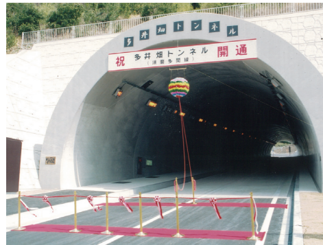
多井畑トンネル開通(平成14年)