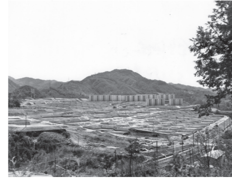
高倉台団地(昭和30年代)