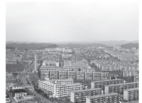
名谷駅周辺(昭和50年代)