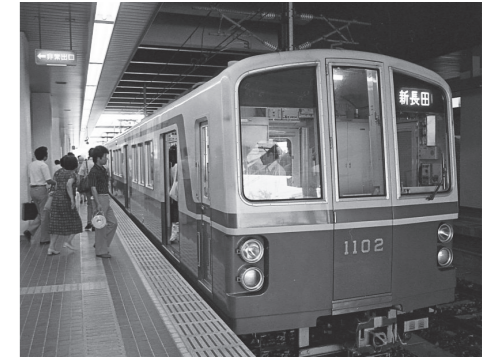
神戸市営地下鉄名谷・新長田開通(昭和52年)