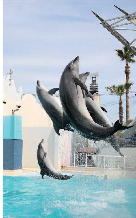
須磨海浜水族園のイルカライブ(平成元年)

昭和40年代から50年代にかけて須磨区の北部の山を削り、その跡地に計画的に、「高倉台」「横尾」「名谷」「落合」「白川台」「北須磨」の6つの団地が造られ、大規模なニュータウンができました。