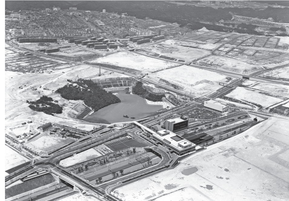
名谷駅付近(昭和40年代)