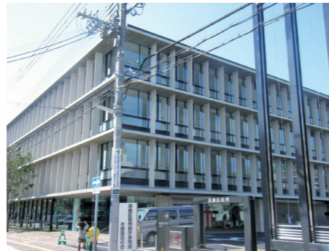
大黒小学校跡地に区役所移転(平成24年)