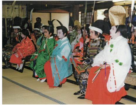
源平子ども夢行列(平成10年)