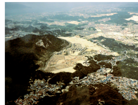
横尾団地(昭和50年代)