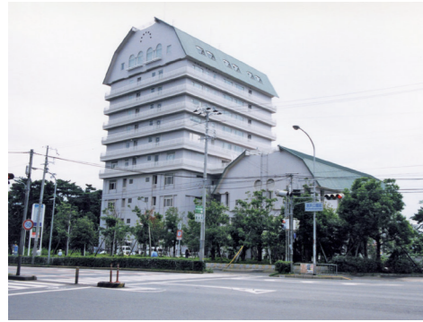
シーバル須磨(平成8年)