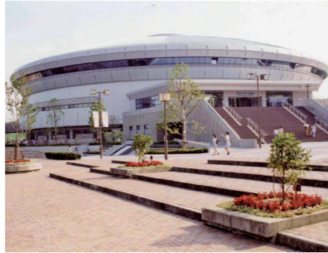
グリーンアリーナ神戸(平成5年)