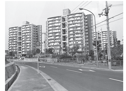
名谷駅周辺(昭和50年代)