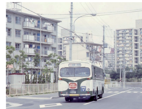
名谷団地(昭和50年代)