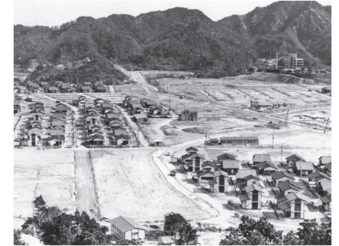
北須磨団地(昭和40年代)