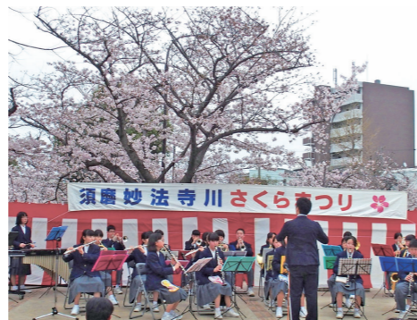
妙法寺川さくらまつり(平成30年)