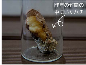
昨年の竹筒の中 にいたハチ