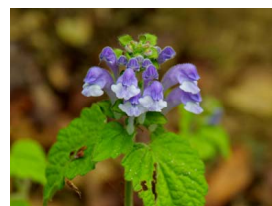
オカタツナミソウ