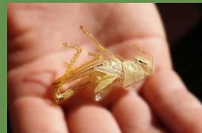
きれいな抜け殻発見