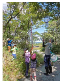
ルリタテハ追跡中 (逃げられました…)