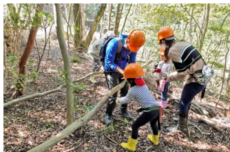
まずは周辺を手入れ

2月にシイタケ菌を打ち寝かせていた原木を起こして組み立てる、ほだ木起こしという作業をしました。