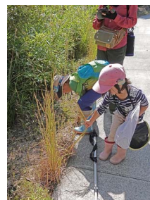
メリケンカルカヤの抜き取り中