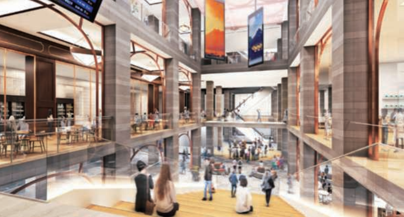
Supported by NEDO