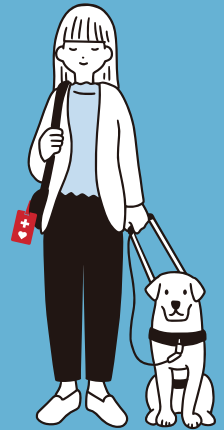
補助犬を連れている方