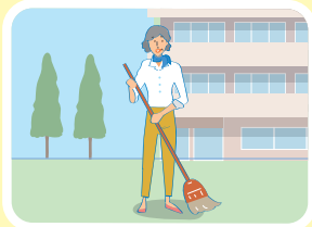
高齢者施設等での掃除、洗濯物の整理などの活動

神戸市内にお住まいの65歳以上の方が、高齢者施設等で下記の対象となる活動を行なった場合に、ポイントを貯めることができ、貯まったポイントは現金と交換できる制度です。