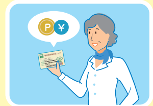
貯まったポイントは現金に交換