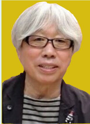
高畠 純 絵本作家