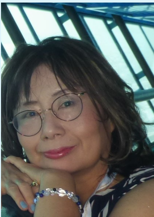
森くま堂 絵本作家