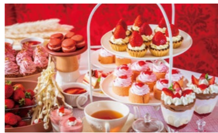
いちごスイーツビュッフェ 6,800円～

船では例を見ない本格的な鉄板カウンターを完備。神戸牛や瀬戸内の海鮮などを目の前でシェフが豪快に焼き上げます。