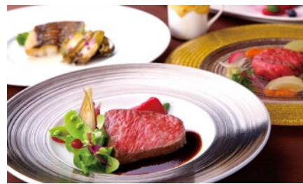
フレンチコース 8,700円～

フランス料理の伝統を守りつつ、神戸らしさやクルーズ船のエッセンスを加えたことでしか味わえないフルコースを。