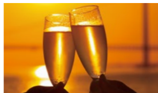
【トワイライトクルーズ】 17:15-19:00(※2)