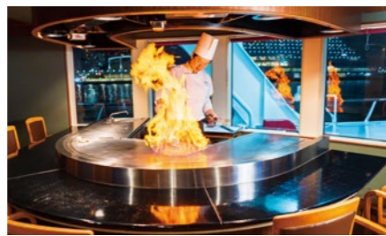
鉄板焼きコース 9,200円～

フランス料理の伝統を守りつつ、神戸らしさやクルーズ船のエッセンスを加えたことでしか味わえないフルコースを。