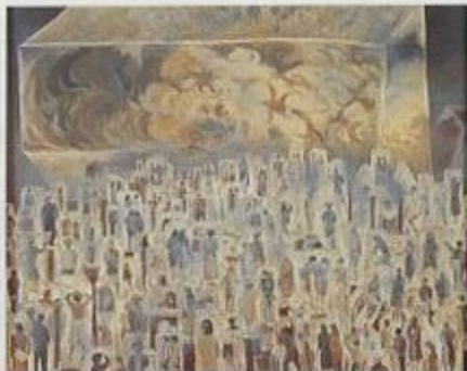
作 品「未来の世界」(野崎和生)