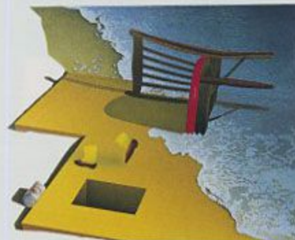
作 品「未来の世界」(野崎和生)