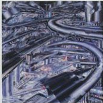
作 品「未来の世界」(野崎和生)