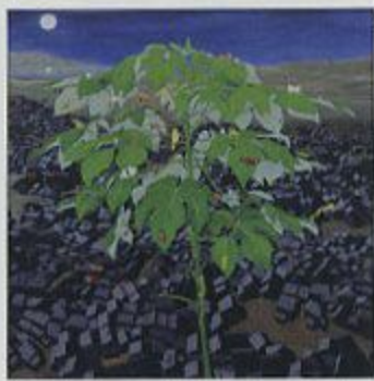
作 品「未来の世界」(野崎和生)