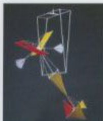
《風の遊れ》2011年油彩 110×110cm 収蔵：東京国立近代美術館