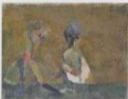
《二人》1951年油彩 110×110cm 収蔵：東京国立近代美術館