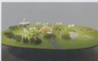
《呼吸する大地(ジオラマ)》2009年油彩 110×110cm 収蔵：東京国立近代美術館