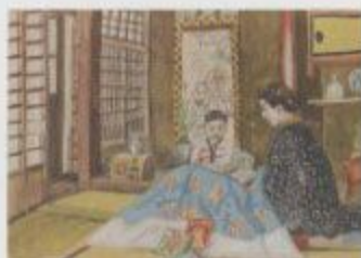
《作家のスタジオ》1964年油彩 210×210cm 収蔵：東京国立近代美術館

本展は、新宮氏の制作の進程を知ることができる初めての回顧展です。初公開作品や資料も多く、新宮氏と小磯良平の長年にわたる深い交流を示すエピソードやコメントを交えた展示からは、新宮氏の新たな魅力を発見していただくことができるに違いありません。