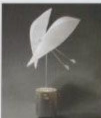
《月の海》2004年油彩 110×110cm 収蔵：東京国立近代美術館