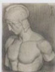
《作家のスタジオ》1964年石膏 110×110cm 収蔵：東京国立近代美術館