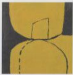
《作家のスタジオ》1964年石膏 110×110cm 収蔵：東京国立近代美術館