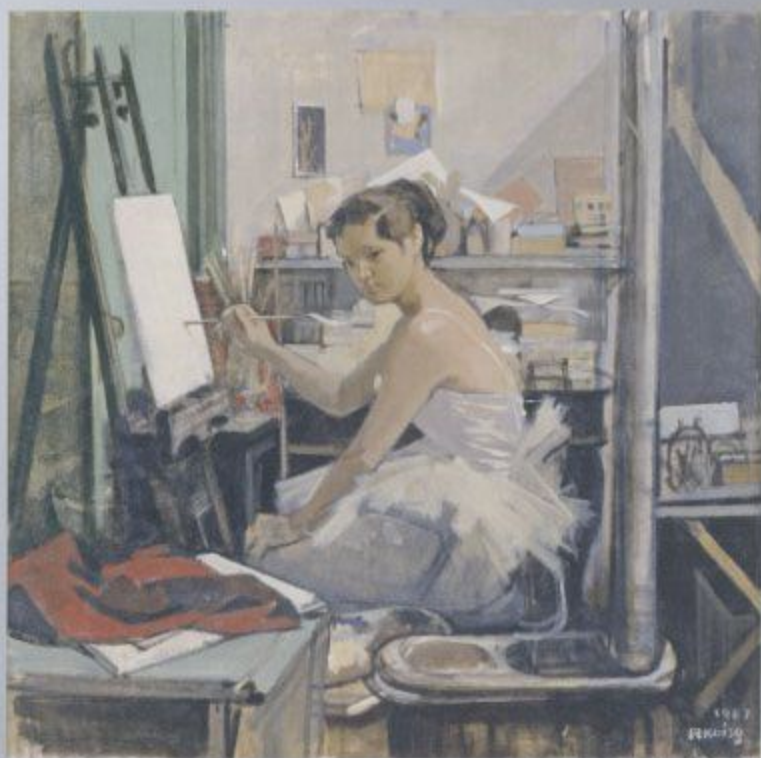
小磯良平「室のハイリーナ」1967年 当館蔵