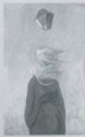
小磯良平【少女】 昭和4年 完成