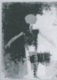
小磯良平【女子高生】 昭和4年 完成