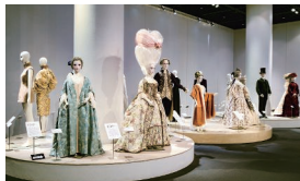
神戸ファッション美術館 TEL 078-858-0050