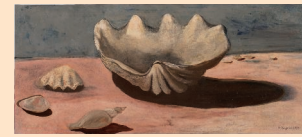
三岸好太郎 《のんびり貝》1934 北海道立三岸好太郎美術館蔵

洋画史上最も有名な夫妻-三岸好太郎と節子の出会いから100年を迎えることを記念した、節子の没後初となる二人展です。本展では、二人の出会いから結婚、好太郎の逝去、その後の節子の奮闘の軌跡をたどります。また、夫婦最後の旅行となった「貝殻旅行」にちなみ、彼らの人生の節目となった「旅」に焦点をあて、好太郎と節子が築いた鮮烈な絵画世界を紹介いたします。