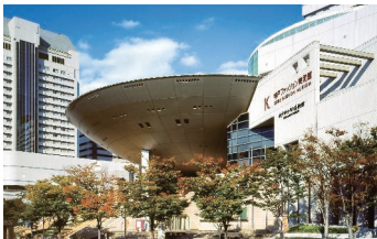
神戸ゆかりの美術館・神戸ファッション美術館 建物外観

六甲アイランドには小磯記念美術館のほかにも、神戸ゆかりの美術館と神戸ファッション美術館があり、芸術・文化ゾーンを形成しています。（3館で相互割引があります。展示の詳細については、各館にお問い合わせください）