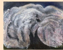
三岸節子 《さいたさいたさくらがさいた》1998 一宮市三岸節子記念美術館蔵