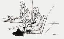
小磯良平 《第220回 少女の顔(三)》 1967 当館蔵