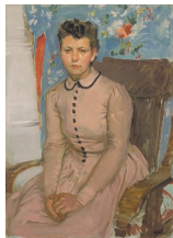
小磯良平 《婦人像》 1944 当館蔵