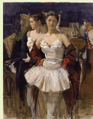
小磯良平《踊り子二人》 1908 泉屋博古館分館蔵