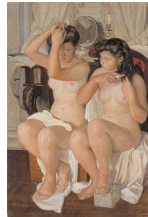
小磯良平 《二人裸婦》 1949 当館蔵