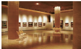
神戸ゆかりの美術館 TEL 078-858-1520