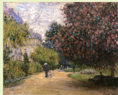
クロード・モネ《モンソー公園》 1876 泉屋博古館分館蔵