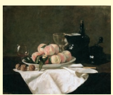
小磯良平 《桃とクミのある静物》 1939 当館蔵

館蔵の小磯良平作品の中から陰影表現の魅力を紹介する企画展示です。小磯は絵の中に空間を作り上げることを意識し、特に光源を重視して制作していました。本展では、光があたることによって生じる「かげ」が、小磯作品の空間の奥行きや人物の存在感を与えていることに着目し、光の効果をテーマに作品を選んで展示します。