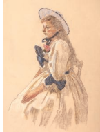
小磯良平《西洋婦人(エステラ)》 1982-84年 当館蔵