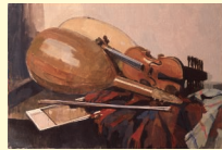
小磯良平 《リュートとバイオリン》1970年 当館蔵

第10回神戸国際フルートコンクール開催を記念して、音楽をテーマに多様な鑑賞方法の可能性を探ります。前半では、神戸の画家たちの作品をモチーフごとに展示します。美術館の壁を楽譜、絵画を音符に見立て、作品同士が生み出す「音色」をお楽しみいただきます。後半は、楽器が描かれた作品を中心に、小磯良平と音楽との関係をたどります。