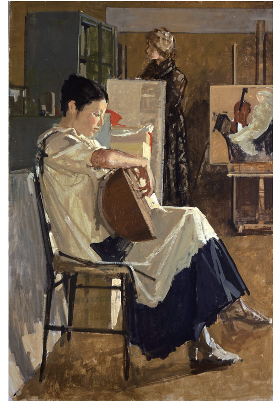
小磯良平《リュートを弾く婦人》1974頃 当館蔵