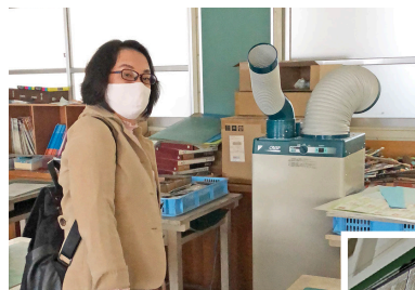
エアコンのない美術室にはスポットクーラー