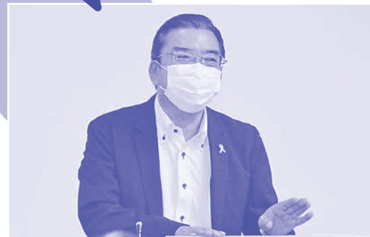
質問する森本真議員