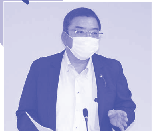
質問する森本真議員

森本議員 ：25年前の国の答弁と一緒に。私有財産に公的支援をと市民の声で、神戸市も行政も動いて、被災者再建支援法