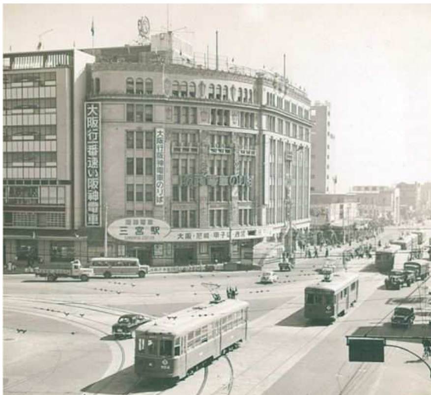
昭和30年代、三宮駅前交差点