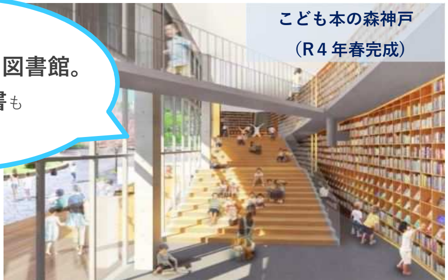
こども本の森神戸 (R4年春完成)