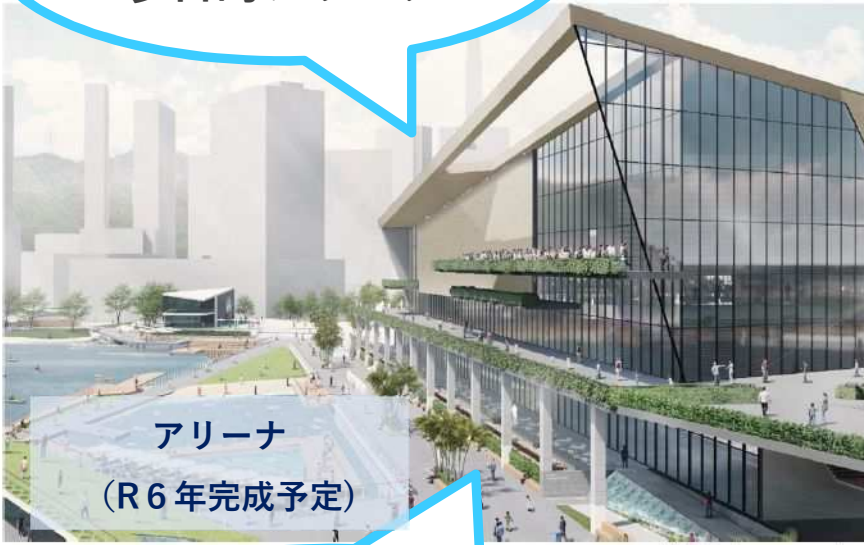
アリーナ (R6年完成予定)