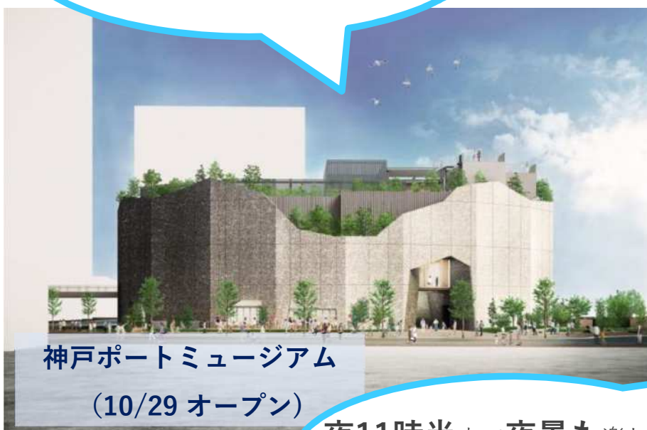
神戸ポートミュージアム (10/29 オープン)