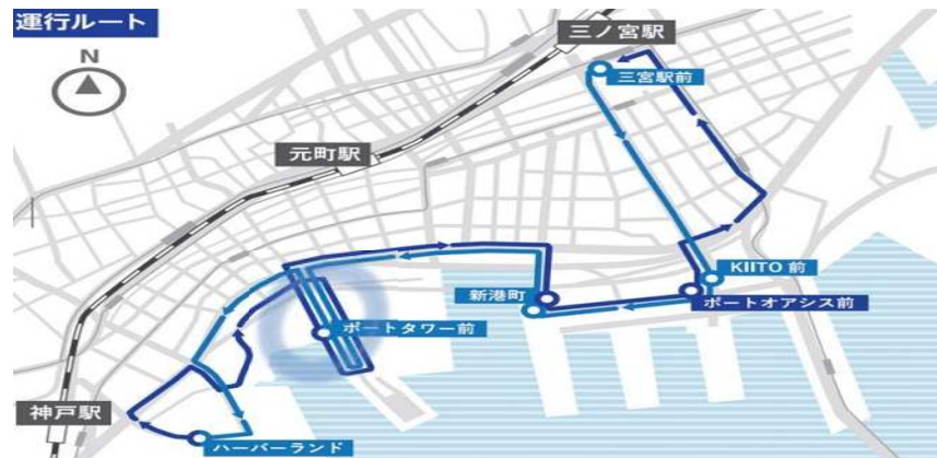
ポートループの運行ルート