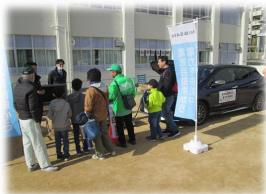
電気自動車活用体験