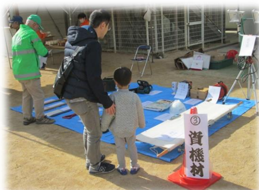
防災資機材取扱い