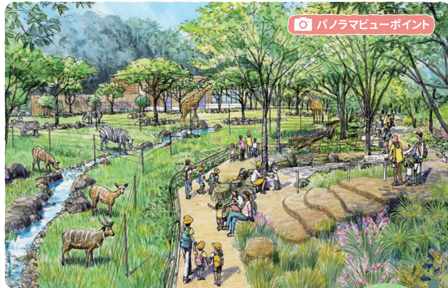
パノラマビューポイント

アフリカのサバンナに生息するキリンやシマウマ、カバなどの複数の動物種を見通せる「通景」の演出や生息環境を再現したゾーンです。ここでは、動物との出会いを楽しみながら、生態や暮らしの様子を観察することができます。