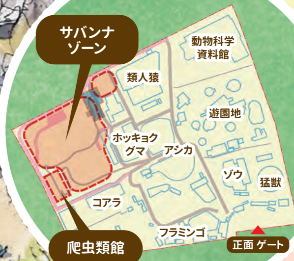
王子動物園全体図