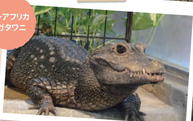
ニシアフリカ コガタワニ