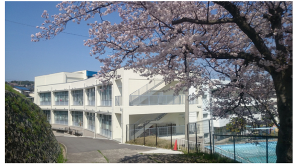
小学部棟 平成 26 年 3 月完成

兵庫県教育委員会の「入学者選考要綱」により実施します。入学願書等の関係書類は、出身学校長を経て、提出してください。