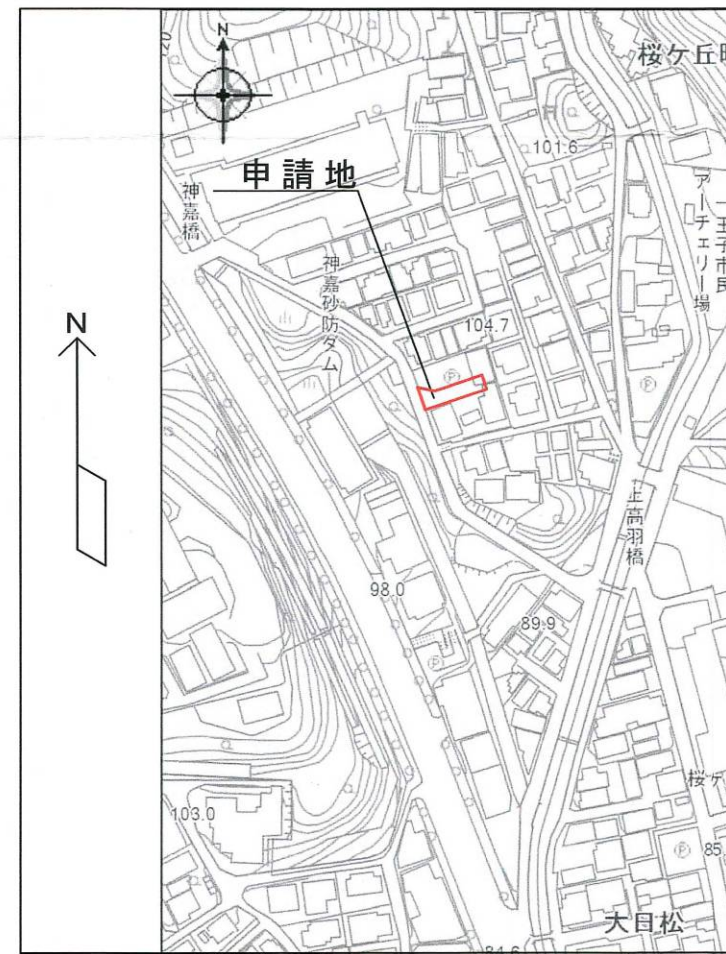
附 近 見 取 図 1/2500