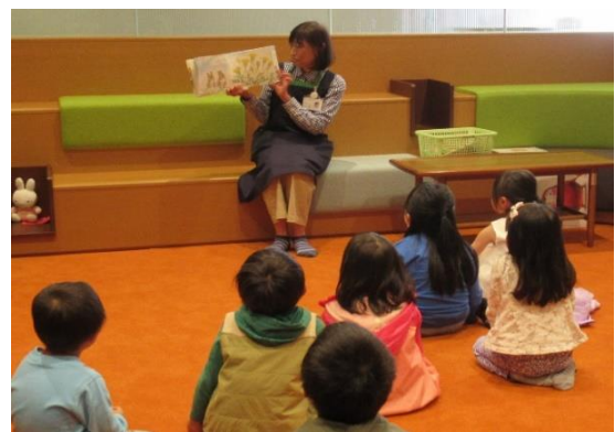
(北神図書館でのおはなし会)