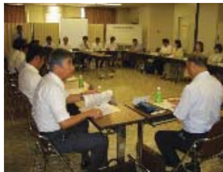
西区感染症対策連絡会

専門機関や教育・福祉関係施設など多方面からの参加のもとに立ち上げた「西区感染症対策連絡会」を基盤として情報共有ネットワークの拡充と連携強化を図り、感染症発生の早期探知および拡大の抑制に努めます。