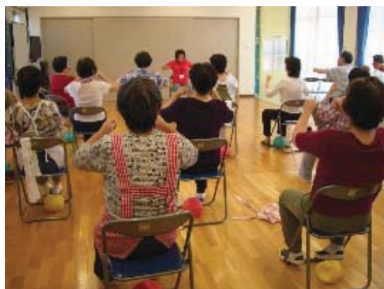
地域でのヘルスアップ活動

地域ヘルスアップ作戦推進員が取り組む健康活動に対し、運動や栄養などの幅広い情報提供や推進員に対する研修を開催し、推進員のレベルアップを図るとともに、各地域の状況に応じた健康増進活動を進めます。