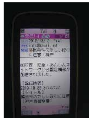
西区メール配信システム

犯罪情報など、安全安心に関する情報を多くの区民に提供する「西区メール配信システム」を普及させるとともに、青色パトロールカーの活用や門灯点灯の推進、声かけをはじめとする見守り活動などをさらに進め、地域防犯力の向上を図ります。