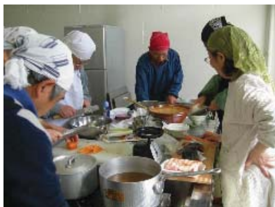
食による健康づくり

健康づくりのためには、運動や休養とともに「食」が重要な要素となります。栄養相談や早寝早起き朝ごはん運動などによる食生活習慣の改善、給食会、ふれあい喫茶などの場を利用した助言、指導を行い、「食」を通じた健康づくりを推進します。