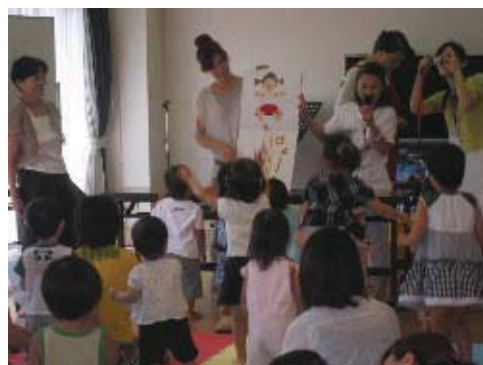
ふれあいのまちづくり協議会の活動

講座方式やワークショップなどによる効果的な研修の企画、実施や地域に出向く研修の実施など、資質の向上を図ります。