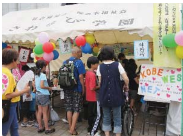
KWNはっぴ〜カーニバルでの啓発活動

KWNの事業を支援し、障がい者が安心して地域で生活できるよう、福祉施設との連携を深めるための協議や研修、啓発事業などを実施するため、関係事業所と地域との結びつきを強めます。