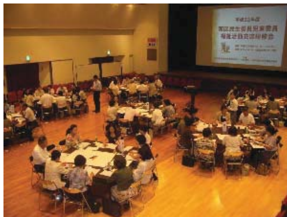
民生委員児童委員福祉活動交流研修会