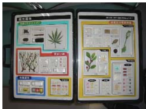
薬物乱用防止に向けた啓発

「こども 110 番 青少年を守る店・守る家」の取り組みの拡充，青少年の居場所づくり，地域パトロールの実施など青少協活動を強化するとともに，警察，学校と連携し，薬物乱用防止，携帯サイト対策などの青少年の健全育成に努めます。