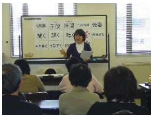
ボランティアの育成支援

高齢者層を中心とした地域住民に対してボランティア講座を実施し、ボランティアグループの結成を進め、その後の継続した活動を支援します。