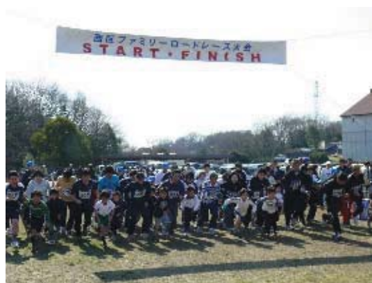
西区ファミリーロードレース大会

西区のまつり「みどりと太陽のまつり」や、地域の文化祭や音楽会など、文化・芸術に親しむ機会や発表の場を提供し、区民が身近に楽しめる機会を増やします。