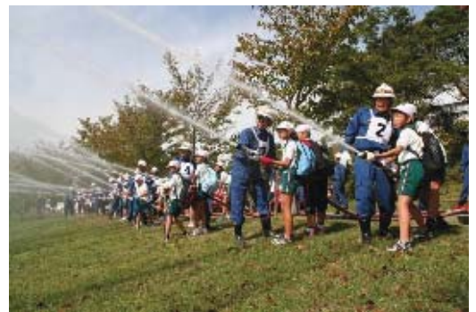
安全安心体験学習

また、各地域のジュニアチームの活動を支援するとともに、活動内容などについて相互に情報交換を行い、各チームの活動の充実を図ります。あわせて、区内全域での結成をめざし、地域への取り組みを行います。