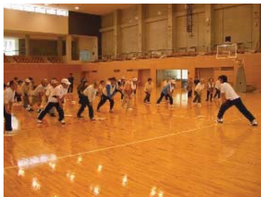
ヘルシーウォーキング研修会

生活習慣病の予防には継続的なウォーキングが効果的です。広く啓発活動を行うとともに，ウォーキンググループを育成し，住民主体の健康づくりを進めます。