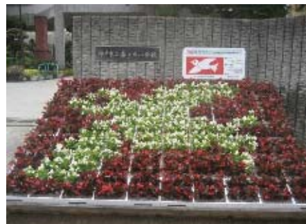
小学校での花絵花壇づくり

区内の小学校で、西区産の花壇苗を使用した花絵花壇づくりに取り組みます。また、まちなかの公園や街路などでの飾花を進め、花にあふれる潤いあるまちづくりをめざします。