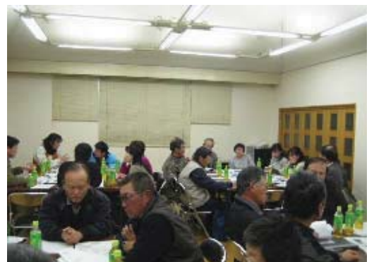
里づくり計画策定会議

里づくり活動の中で，都市部商店街と農村との交流などの地域間交流や各地域の特産品づくりといった魅力アップに繋がる取り組みに対して支援を行います。また，地域単位で取り組んでいる希少生物の保護活動については，ホームページなどを通して，その取り組みを広報します。