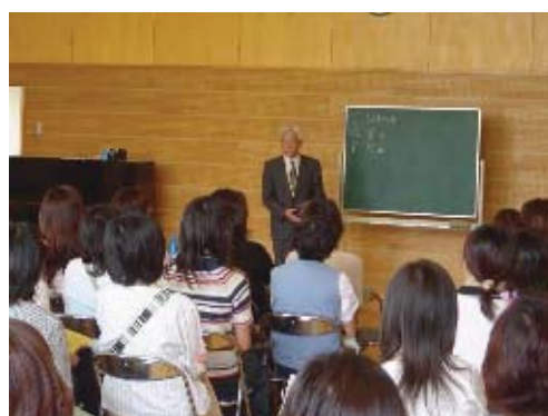
こどもへの暴力防止プログラム(CAP)

区の子育て支援室では、母子健康手帳交付時や乳幼児健診などの機会を活かして、母親などの子育ての不安解消及び虐待の早期発見に努めます。また、乳幼児健診の未受診児に対しては、子どもの安否確認を行うため、家庭訪問を実施します。児童虐待