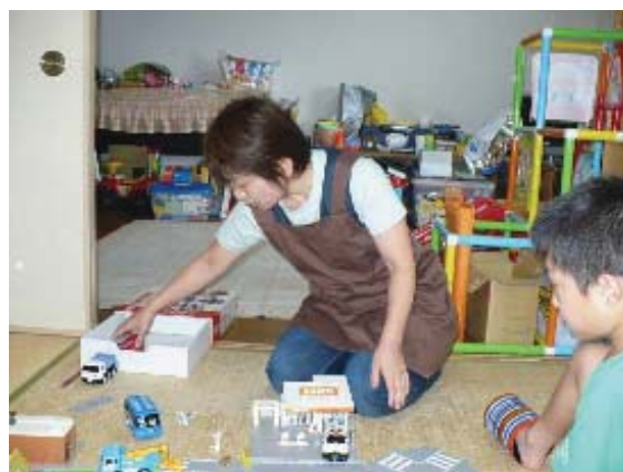
子どもと親の応援隊

乳幼児健診の機会を活用するとともに、発達障がい児が通う学校・園との連携を密にすることにより、発達障がい児の早期発見に努めます。あわせて児童委員などが地域の見守りを行い、相談に応じます。また、発達障がい児の支援に取り組むNPOや地域団体と協働して、地域における「子どもと親の応援隊」の継続的な取り組みを進めます。