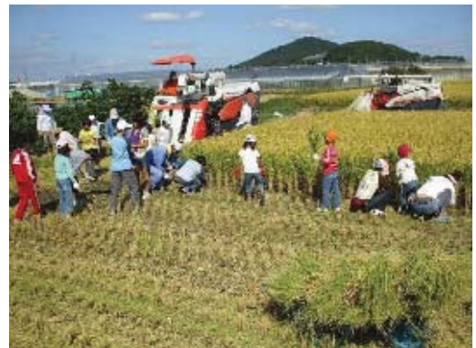
農業体験を通じた都市と農村の交流

豊かな自然環境を活かして、農村部とニュータウンの相互交流を行い、西区産の農産物の直売や、田植えなどの自然体験を通して、区の魅力を都市部に広く発信します。情操教育や西区産の食材を活かした食育により、人と人との交流や、次代を担う子どもたちの育成を図ります。