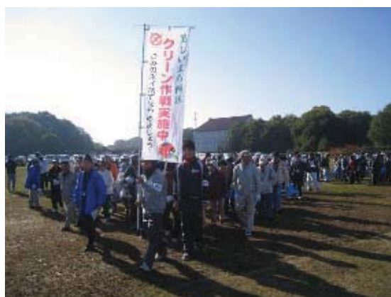
地域主体のクリーン作戦

地域活動としてクリーン作戦を実施し、暮らしに身近な地域の美化に努めます。住民主体の美化活動については、ごみの出し方・マナーの周知を図るほか、資材の提供などを通して活動を支援します。