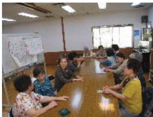
地域でのデイサービス

また、介護などの支援の必要な方に対しては、総合的、効率的な支援を行うため、「えがおの窓口」など福祉関係機関、あんしんすこやかセンター、地域住民の連携を強化します。