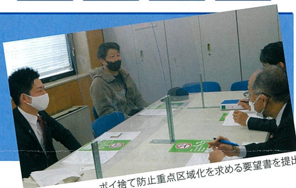
ポイ捨て防止重点区域化を求める要望書を提出

先日テレビやネットで神戸駅北側を清掃する方々のニュースが話題となりました。何とお子さんが呼びかけて行われた、大人が出した飲食やタバコのゴミを片づける清掃活動です。同じ大人としてこんなにも恥ずかしいことはありません。