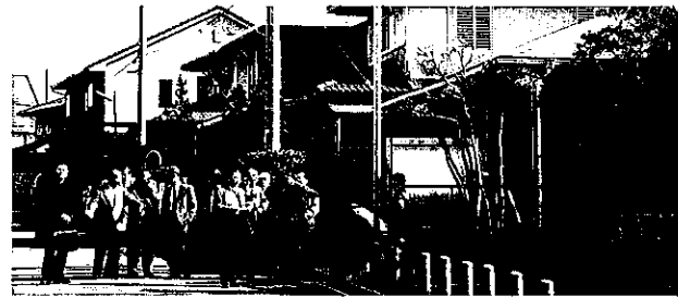
学園緑が丘地区(小東山六丁目)の視察

また、この度の更新にあたって①一区画一戸建て②区画及び地盤面の高さの変更禁止③外壁後退距離一メートルを規制内容として追加しています。意見交換では不参加区画ができた事情、不参加区画が簡単な手続きで協定区