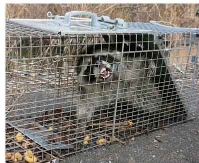
有害鳥獣・外来生物対策

利子所得として20.315%(所得税・復興特別所得税 15.315%+地方税 5%)が課税されます。