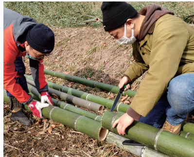
多井畑西地区の里山保全・活用

下記の取扱金融機関にてご購入いただけます。(神戸市役所では販売していません。)ご購入の際には、必要な手続きが各金融機関によって異なる場合があります。口座管理手数料等が必要となる場合がありますので事前に取扱金融機関にご確認ください。