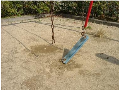
事故のあとの様子。座板が片方落ちています。