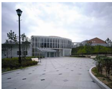
埋蔵文化財センター概観

神戸市内各地の遺跡から出土した1万年前から江戸時代までの石器や土器、埴輪などを展示しており、むかしの人びとが使った道具から神戸の歴史