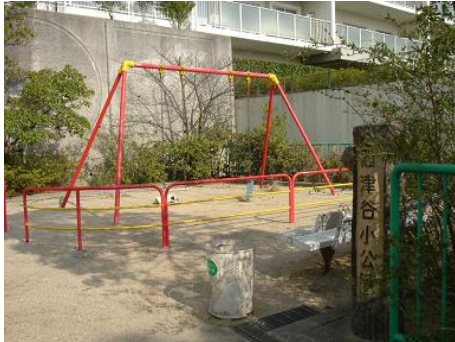
事故があったブランコの全景。どの公園にもあるタイプのブランコです。

いたずらなのかどうかわかりませんが、皆様の公園においてもありえる話ですので、のる前にはチェックしてみてください。