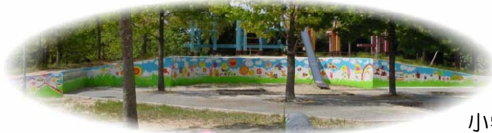
小学生が描いた壁画