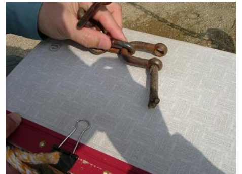
座板とチェーンをつなげている金具にささっているはずのピンがなく木の枝がささっていました。