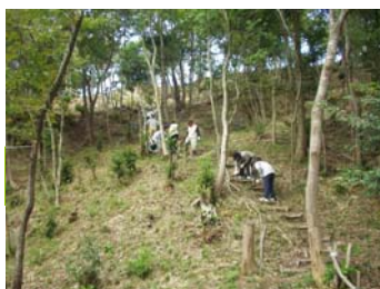
階段づくりや間伐作業

こうした活動を通じて、公園の豊かな自然が身近な里山として再生され、地域住民の皆様の憩いの場、そして子供たちの環境学習の場として活用されています。