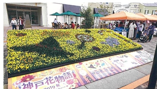
花で絵を描く「花絵」の様子