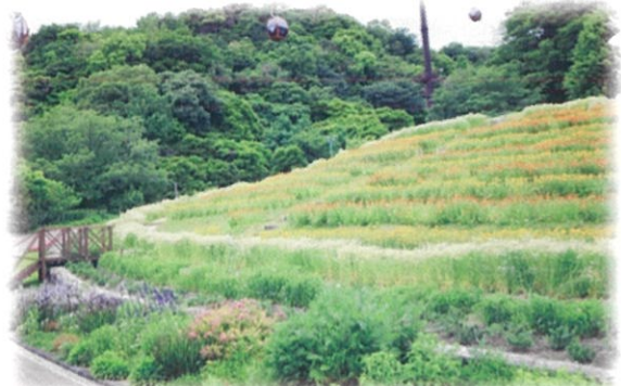
風の丘フラワー園

2020年3月14日(土)～7月5日(日) GARDEN FEST 2020 -Spring- 開催