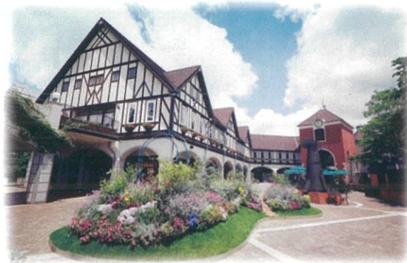
ウェルカムガーデン

季節ごとに、園内に植えられているハーブの摘み取り体験や花束づくりなど、その時にしか体験できないイベントも開催しています。