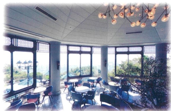
ザ・ヴェランダ神戸 2F カフェラウンジ