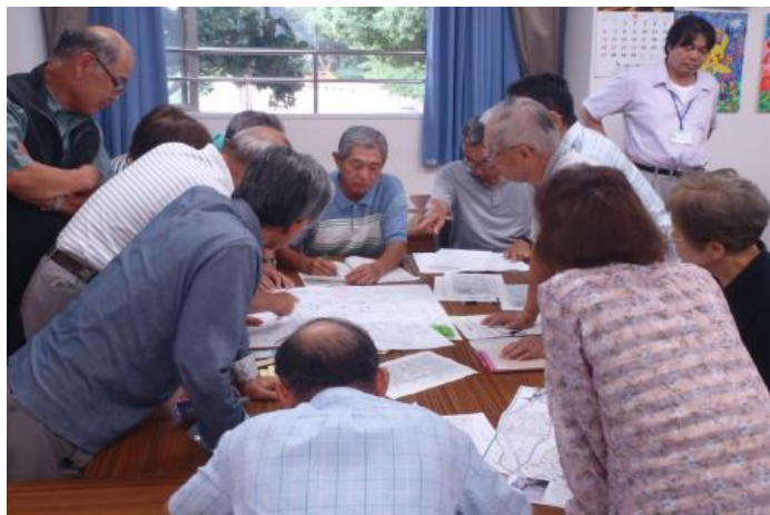
要援護者マップづくり