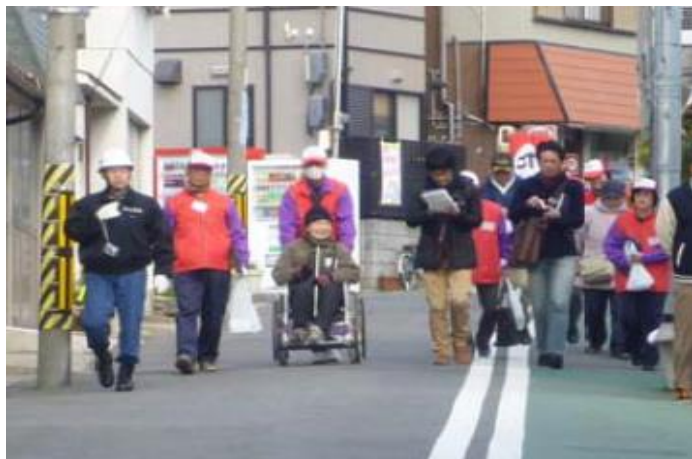
付き添い避難訓練