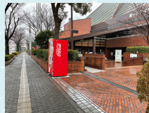
スポーツセンター入口