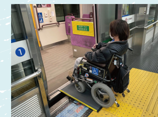
乗降時のスロープ対応