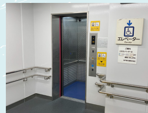
車椅子対応エレベーター