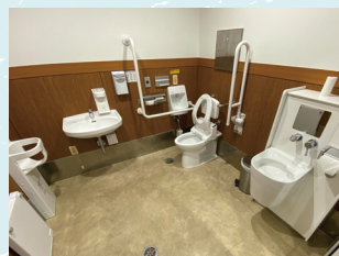
バリアフリートイレ

ポートアイランドエリアは歩道が整備されていて平坦です。ポートライナーの各駅にはバリアフリートイレ・車椅子対応エレベーターが完備されています。このエリアは南北にかけて高架歩道があり、高架歩道に上がるために数ヶ所に車椅子対応エレベーターがあります。視覚障害者誘導用ブロックも要所に敷設されています。