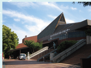
ポートアイランドスポーツセンター

神戸市立ポートアイランドスポーツセンターは、スポーツ教室や大会も開催される本格的なスポーツ施設です。25m温水プール・50mの競泳プールが揃ったプール施設と、サブリンクも併設されたスケート施設があります(営業期間等要確認。プールでは水泳帽子、スケートでは手袋を必ず着用してください)。25mプールは、年間を通しての利用が可能です。お子さま用プールも併設しているので、家族みんなで楽しめます!(スケートリンクは冬季のみ、50mプールは夏期のみ)オリンピック事前合宿およびワールドマスターズゲームズ2021関西「競泳」競技の会場となります。