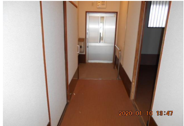
・玄関（室内から外向きに撮影）