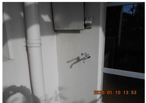
・ベランダの洗濯水栓とコンセント