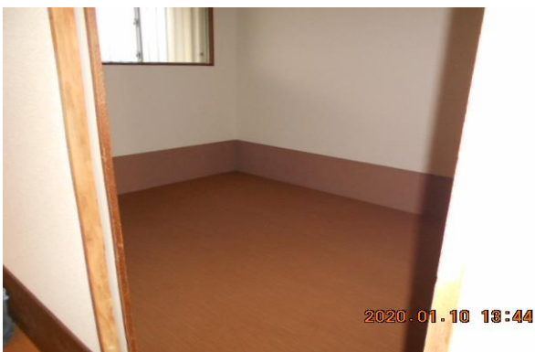
・玄関から左の洋室