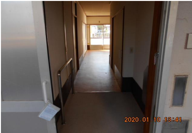
・玄関（外から撮影）