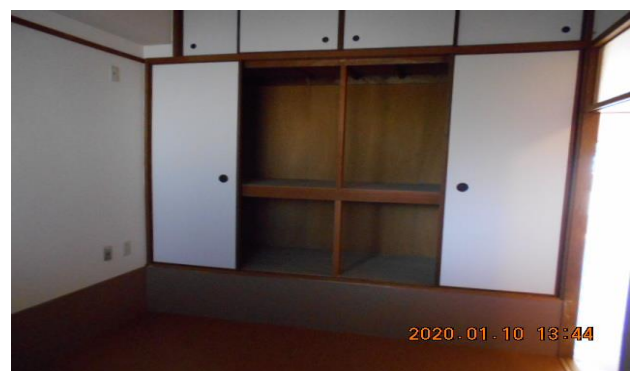
・左洋室の押入れ