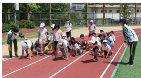
走り方教室で学んでいる様子