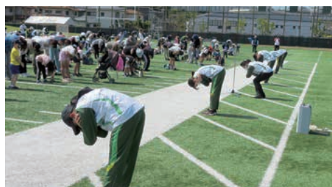
親子で姿勢バランス講座を受けている様子