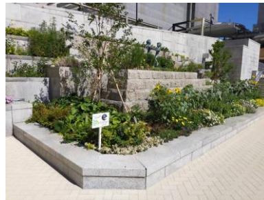
【プレんティ広場花壇】