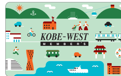
新ポイントカード