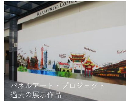
パネルアート・プロジェクト 過去の展示作品

神戸芸術工科大学の協力を得て、2020年よりショッピングセンターの空き区画仮囲いをキャンパスに見立て学生たちが制作した作品を展示する「パネルアート・プロジェクト」を実施してきました。この度のプレんティのリニューアルでは、地元・西区をテーマに学生たちが制作した作品をパークアベニュー沿いウィンドウに常設展示します。