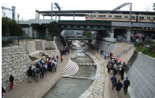
＜都賀川整備状況（イベント：都賀川ウォーク）＞

昭和20年代までは清流でしたが、30年代後半から家庭の雑排水等の流入により汚染が進み、一時は魚の住めない川になっていました。そこで、清流を呼び戻そうと住民が主体になった活発な河川愛護運動が広まり、今では鮎が遡上し蛸も生息できるようになっています。