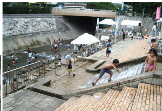
＜生田川公園ふれあい広場＞