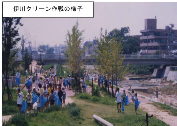
伊川クリーン作戦の様子