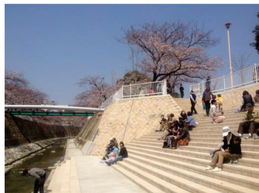
＜妙法寺川での階段の設置状況＞