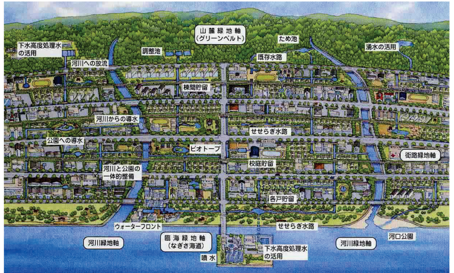
＜水とみどりのネットワークのイメージ＞

環境形成帯は、河川や河川沿いの緑地、公園、道路を一体的に整備するもので、表六甲河川のうち主要な6河川（住吉川、石屋川、都賀川、生田川、新湊川、妙法寺川）を重点的に整備しています。河川としては、階段護岸、河川敷へのスロープ、渡り石、取水ピットなどを整備しています。