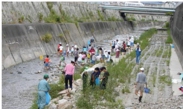
＜親水性を持たせた河道整備（清掃活動の状況）＞