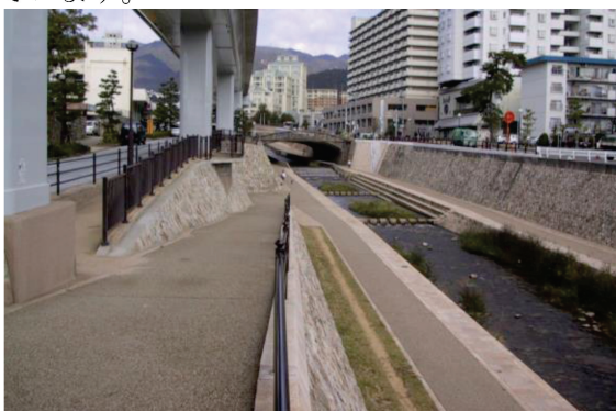
＜住吉川でのスロープや渡り石の設置状況＞ 災害時には、避難路や取水拠点として利用できます。

妙法寺川は、神戸市北区ひよどり台の山中に端を発し、大阪湾に注ぐ二級河川です。妙法寺川では河川沿いに桜並木が整備され、「桜の回廊」として市民に親しまれています。ここでは河川沿いにある公園から河道内に入れる階段を整備しています。