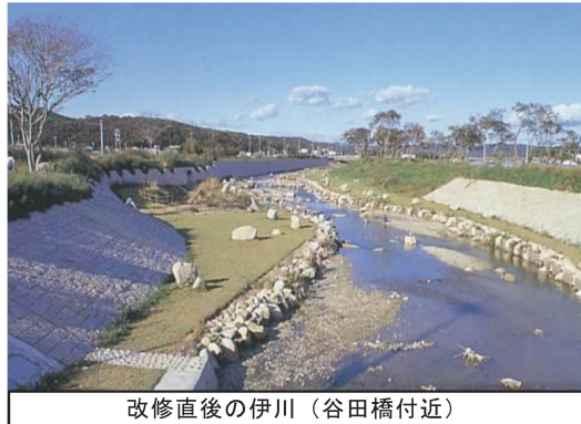
改修直後の伊川（谷田橋付近）

伊川は、六甲山系の西端にある「しあわせの村」付近を源とし、明石公園北側で明石川に合流する市内では比較的規模の大きな二級河川です。上・中流域は、のどかな田園地帯をゆるやかに流れ、一部、太山寺付近で急峻な渓谷となっており、河畔には緑が繁り、豊かな自然が残されています。