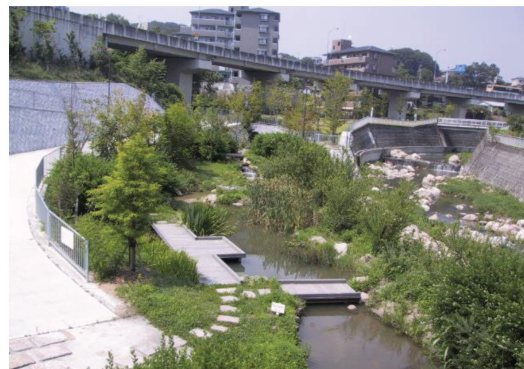
＜親水広場（福田川すいすいパーク）＞

福田川沿いは、住宅等が建ち並んでいるため、旧河川敷など限られた空間を利用して親水広場を整備したり、河川管理用通路を遊歩道として整備するなど、地域の人々が気軽に水辺にふれあえるようにしています。また、河道内でも河床切り下げ工事にあたっては、少しでも親水性や自然の回復ができるような整備をしています。