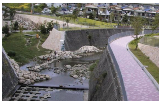
＜（遊歩道）福田川プロムナード＞