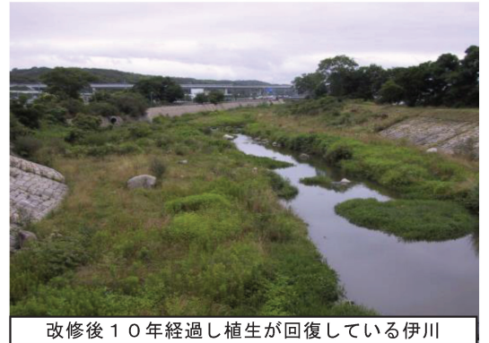
改修後10年経過し植生が回復している伊川