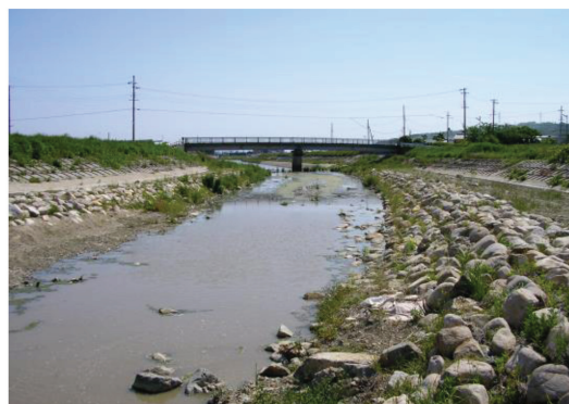
<櫛谷川二次改修> 掘り下げた後の護岸は、自然石を用いるなど環境に配慮しています。

こしていました。そのため、大規模な開発にあわせて暫定改修を行いました。その後、下流の明石川の改修が行われ、櫛谷川の更なる改修が可能となったため、河床を掘り下げる改修（二次改修）を進めています。